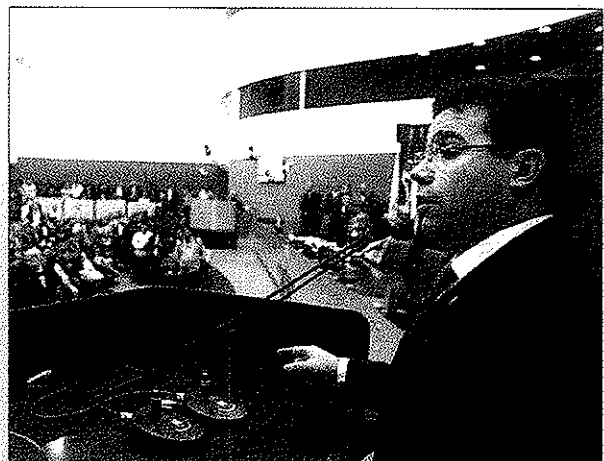
Presidente da CMM afirma que não quer a presença de "claques" na audiência pública

A planilha do transporte coletivo de Manaus foi apresentada pela Superintendência Municipal de Transportes Urbanos (SMTU) na última sexta-feira, durante uma audiência pública promovida pela Comissão de Transporte, Mobilidade Urbana e Obras Públicas da CMM.