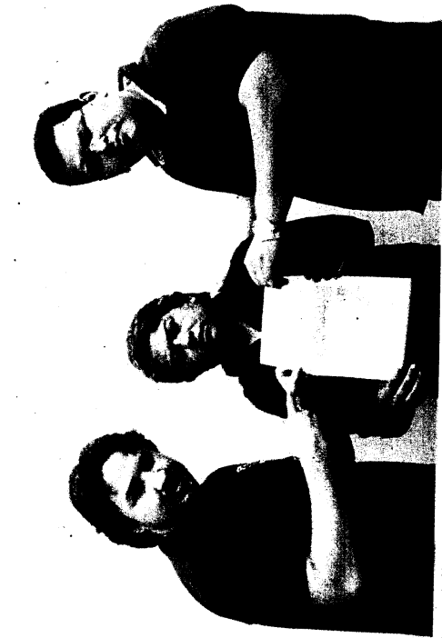
Dirigentes do Sindicato dos Músicos querem apuração dos gastos da Prefeitura de Manaus com atrações nacionais

Na ocasião, artistas entrevistados pelo jornal cobraram uma postura por parte do sindicato.